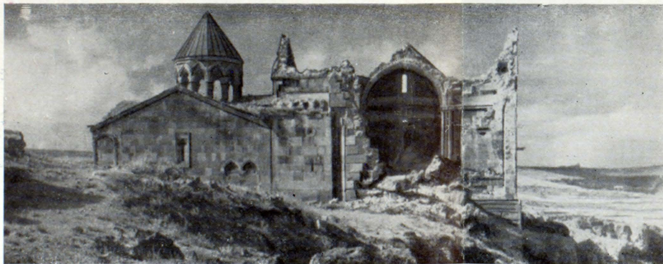
Ընդհանուր տեսքը հարավից

պլունարաբնի որսնակամարներով: Վերջին վերակառուցման ժամանակ պատերի շարվածքում օգտագործվել են վանքի այլ շենքերի քարեր ևս: Օրինակ, արևելյան ճակատին պահպանվել է Վաչուտյան իշխանական տոհմի զինանշանը պատկերող հարթաքանդակը (արժիվը՝ ճանկերում աղավկի):