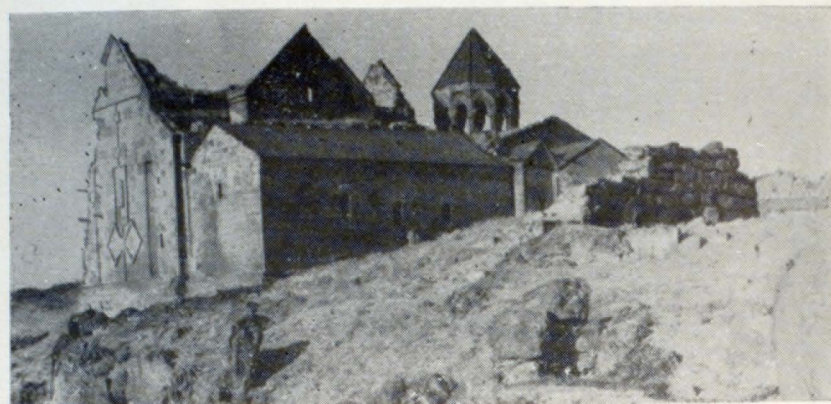
Ընդհանուր տեսքը հյուսիս-արևելքից

Հովհաննավանքի համալիրը գտնվում է Աշտարակի շրջանի համանուն գյուղում, Քասախ գետի անդնդախոր ձորի եզրին: Ըստ ավանդության, վանքը հիմնադրվել է IV դ. սկզբին, երբ Գրիգոր Լուսավորիչը կառուցել է համալիրի հնագույն շենքը՝ միանավ բազիլիկը: Այն վերակառուցվել է 573 թ., երբ փայտե ծածկը փոխարինվել է քարե թաղով, և 1652 թ., որի ընթացքում աղավաղվել են վաղ միջնադարի հայ ճարտարապետությանը բնորոշ այս հուշարձանի նախնական ձևերը: Համեմատաբար լավ է պահպանվել եկեղեցու արևմտյան ճակատը՝ պայտածև կամարներով երեք լուսամուտով, մուտքով և արտաքին