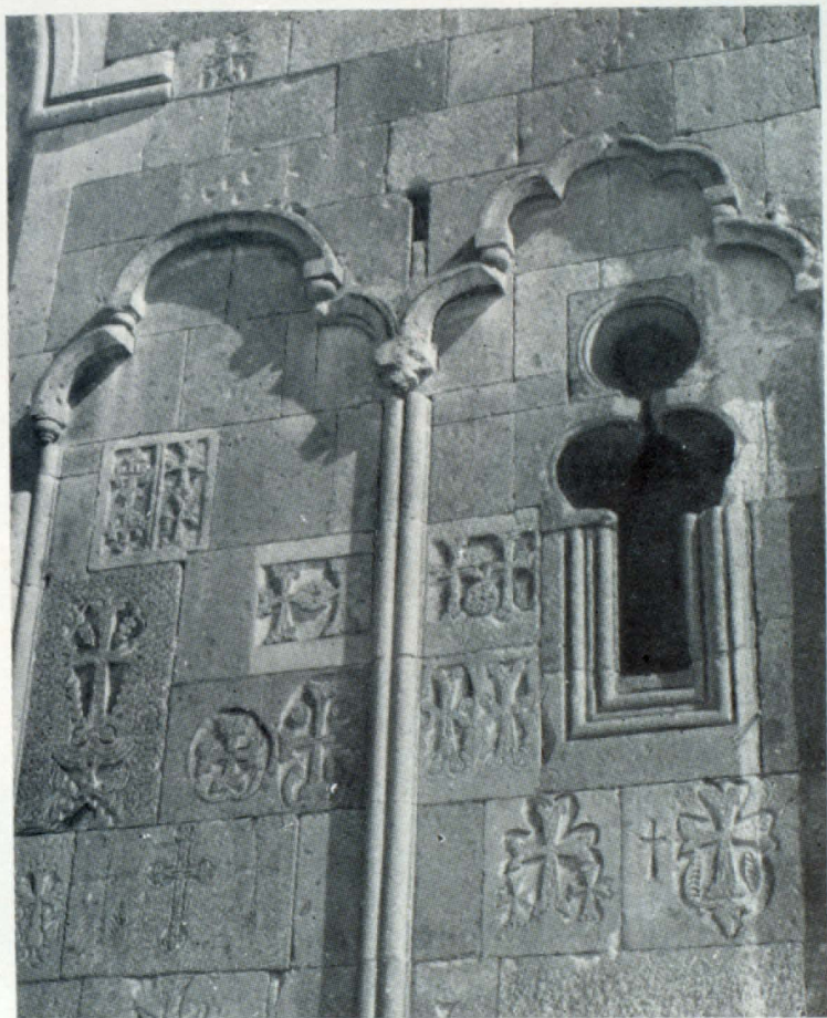
Ժամատան արևմտյան ճակատի մանրամաս