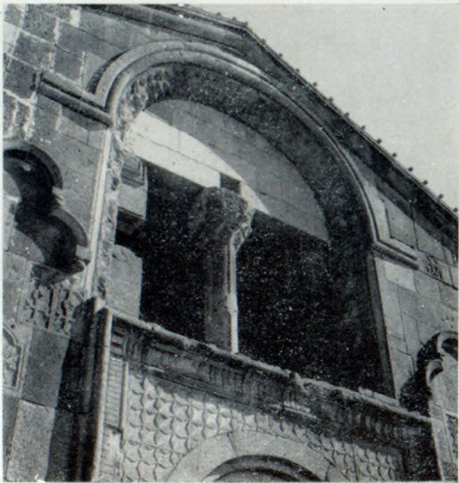
Ժամատան արևմտյան շքանտրթի վերևի լուսամտի մանրամաս

Սակայն հարթաքանդակը հետաքրքրական առանձնահատկությամբ տարբերվում է կանոնիկ պատկերագրությունից՝ կույսերի փոխարեն տղամարդիկ են պատկերված: