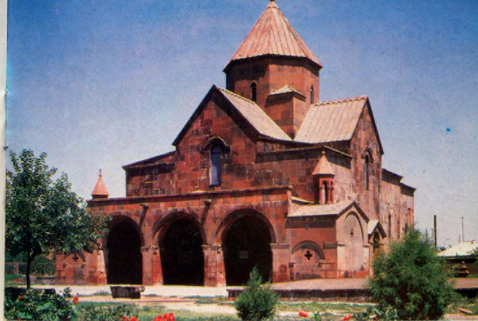
Գայանե տաճարի տեսքը հարավ-արևմուտքից

Դարերի ընթացքում Էջմիածնում կուտակված և հայ ժողովրդի պատմության, մշակույթի ու կենցաղի համար կարևոր նշանակություն ունեցող մեծարժեք հուշարձանների բնույթը ու տեղադրությունը թելադրել են քաղաքի տարբեր հատվածներում ստեղծելու պատմա-