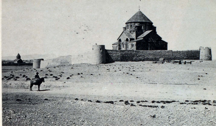
Հատված Վաղարշապատ քաղաքի հյուսիս-արևելյան մասից, 19-րդ դ. վերջ.

Այժմ հանրապետության պատմական քաղաքների և նրանցում կուտակված բազմաբնույթ հուշարձանների պահպանման խնդիրները համակողմանիորեն լուծվում են Հայկական ՍՍՀ Մինիստրների