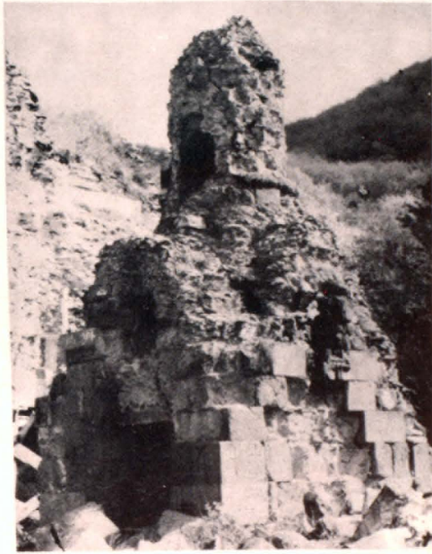
Ս. Կիրակի եկեղեցու տեսքը հարավ-արևմուտքից