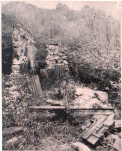
Եղեղեցու արևմտյան համալիրից արևելք (ս. Ճգնավար եկեղեցի)