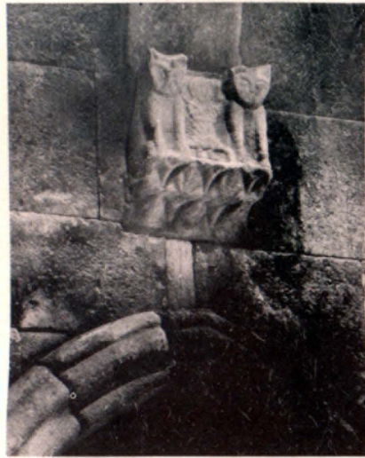
Քանդակ գավթի նախնական ևն-հին պատին