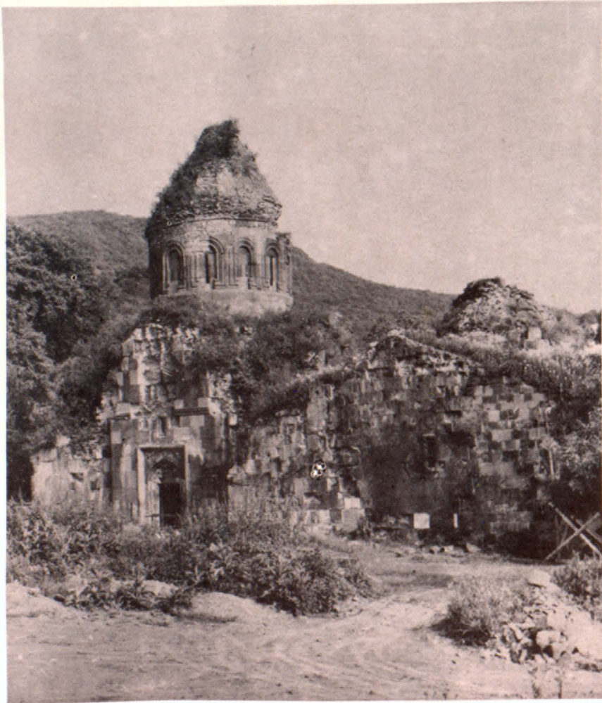
Խորանաչատ. Համալիրի ընդհանուր տեսքը հյուսիսից

«Պատմական հուշարձանների և կուլտուրական մյուս արժեքների պահպանության նկատմամբ հոգատարությունը Հայկական ՍՍՀ քաղաքացիների պարտքն ու պարտականությունն է»: (ՀՍՍՀ սահմանադրություն, հոդված 66)