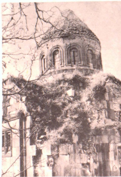
Գլխավար եկեղեցու տեսքը նյութա-արևելից

ցի վանքի (Հրազդանի շրջան) գավթի կենտրոնական հատվածի գմբեթային ժածկի նմանությամբ այն իրականացված է փոխադարձ հատվող 6 կամարներով, որոնք այս կառուցվածքում շրկամարների գեր են կատարում: