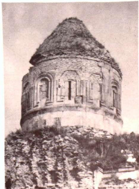
Գլխավոր եկեղեցու գմբեթը