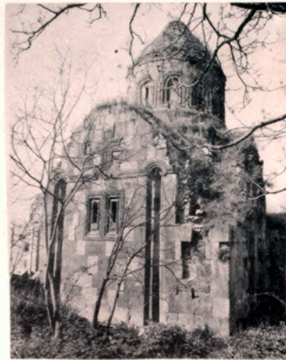
Գլխավար եկեղեցու տեսքը նյութա-արևելից