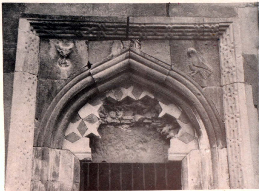
Գլխավոր եկեղեցու հյուսիսային շէմսուտի մտերմատ

սահմաններից ղուրս, գտնվում է ս. Կիրակի եկեղեցու նմանությամբ մի այլ փոքր եկեղեցի: Միջնադարյան գերեզմանատուն (որտեղ ենթադրությամբ թաղված է վանքի հիմնադիր Հովհաննես Վահագանը) և զարդանախշերով զարդարուն թեափոր մի խաչքար: