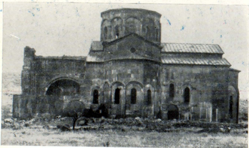
Մեծ տաճար, հյուսիսային ճակատ

Թալինը շրջանի վարչական կենտրոն և ետնապատերազմյան տարիներին զգալիորեն աճած ու վերափոխված քաղաքատիպ ավան է: Հարուստ է վաղ միջնադարի արժեքավոր հուշարձաններով՝ եկեղեցական շենքերով, կոթողներով, խաչքարերով, միջնադարյան կառուցվածքների մնացորդներով և այլն: