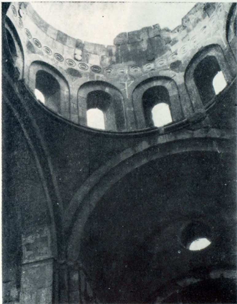
Մեծ տաճար, գմբեթի թմբուկի ներքին տեսքը

եռախորան գմբեթավոր բազիլիկ կոչված տիպին: Դրա նախօրինակը VII դարի սկզբին վերակառուցված Դվինի ս. Գրիգոր տաճարն է, որը եռանալ բազիլիկից վերափոխվել է եռախորան տաճարի: Այդ իրականացվել է երկաշնական պատերին հավելելով խորաններ, որոնք ներսից կիսաշրջան են, արտաքինից՝ բազմանիստ: Հոհնվածքային այդ նոր գաղափարը Թալինի տաճարում կատարելագործվելով, վեր է ածվել մի ալվարտուն, ինքնուրույն ու վաղ միջնադարյան եկեղեցիների մեջ միակը հանդիսացող տիպի: Ի տարբերություն նախօրինակի, տաճարի հատակագծում ճշտված են ստանձին մասերի փոխադարձ կապն ու համաչափությունները, ընդհանուր նկարվածքը: