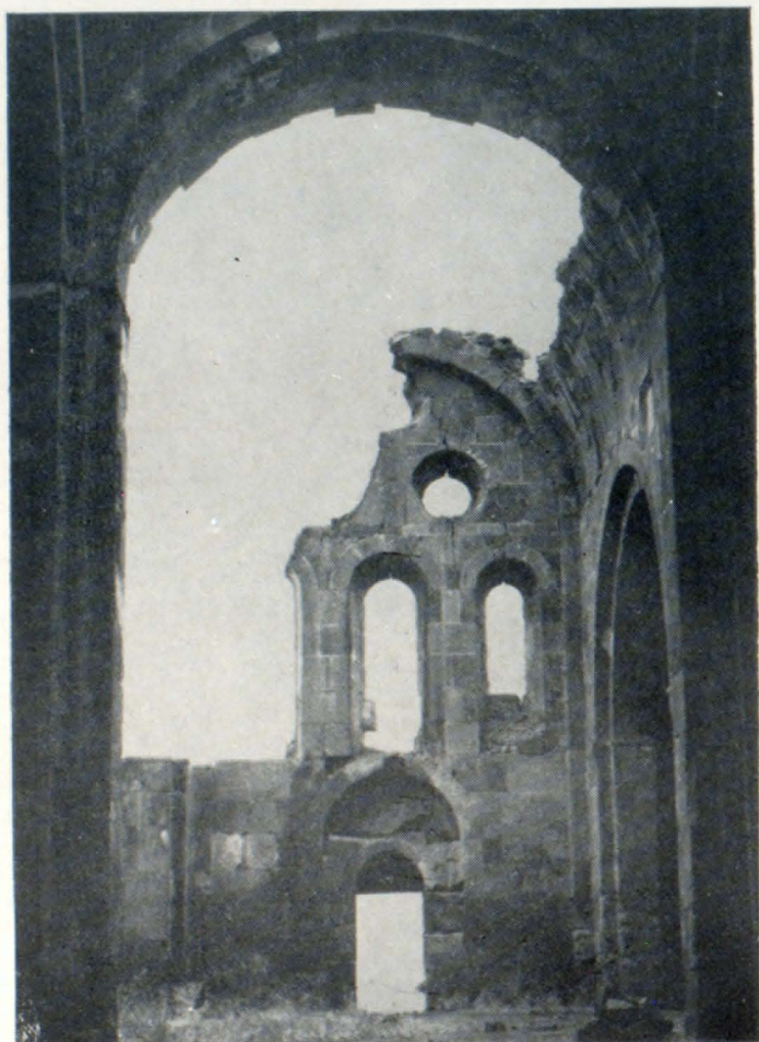
Մեծ տաճարի արևմտյան ճակատի ներքին տեսքը

ճառագում յուրաքանչյուր նիստի որմնակամարների համար: Խոշակներում ու որմնակամարներում օգտագործված են նույն տերևի ու պտղի, խաղողի ողկույզի ու տերևների մոտիվները: Հարդարանքի նույնատիպ մոտիվներով մշակված է գմբեթի բազմակիստ թմբուկը: Տաճարի շքամուտքերում, արևմտյան պատի զույգ խորշերում և բոլոր յուսամուտների կամարուների ձևերն ու արտահայտչամիջոցները համահնչյուն են, կազմում են Թալիհի Կաթողիկեի միասնական ոճական նկարագիրը և հարազատ են VII դարի հայ ճարտարապետության ավանդույթներին: