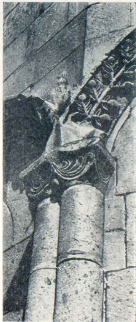
Մեծ տաճարի հյուսիսային ճակատի մանրամաս

Տաճարի արտաքին ճարտարապետության հարդարանքի միջոցները բնորոշ են VII դարի առաջին (Զվարթնոց) և երկրորդ կեսերի (Արունի, Արթիկի մեծ տաճարներ)՝ բուշարձաններիին: Խորանների արտաքին բազմանիստ ծավալների անկյունները հարդարված են զույգ որմնաաղյուներով, որոնք հենարան են