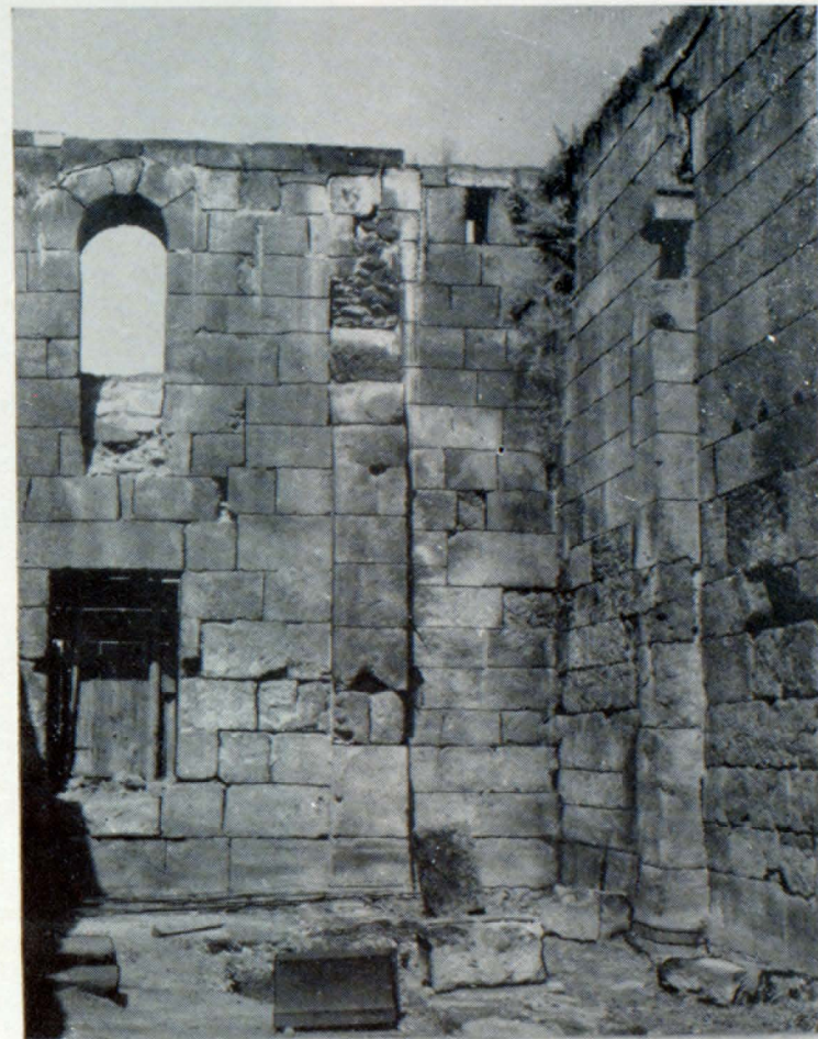
Արևմտյան պատի ներքին տեսքը

Բազիլիկի ընդհանուր կառուցվածքում ակնառու է ճարտարապետական երկու