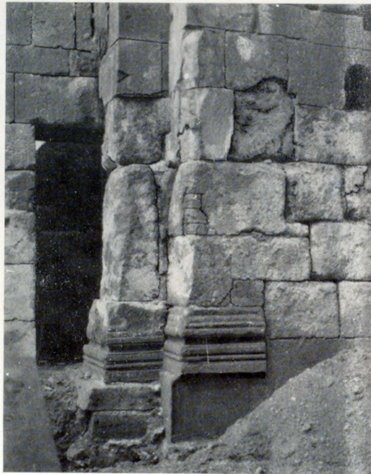
Ներքին տեսքի մանրամաս