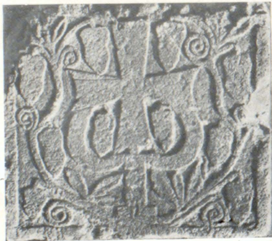
Բարավորի քանդակազարդ մանրամաս

Նշանակում է, տաճարին հետագայում ավելացված մասերը, որոնք կառուցվել են քրիստոնեական կրոնի ընդունման անդրանիկ դարերում (IV—V դդ.) առնչվում են նույն ժամանակաշրջանի համանման կառուցվածքների արվեստի հետ, իսկ սկզբնական կառուցվածքը, որը ստեղծվել է մինչև այդ հավելումները, հետագայով այդ ժամանակաշրջանից՝ մոտենում է Հայաստանի նախաքրիստոնեական շրջանի ճարտարապետական արվեստին: