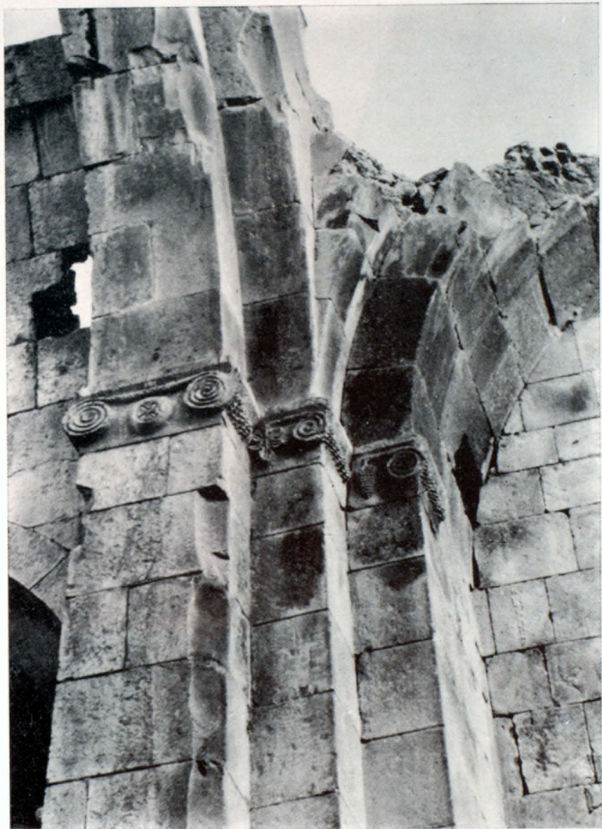
Հարավ արևելյան մույթը