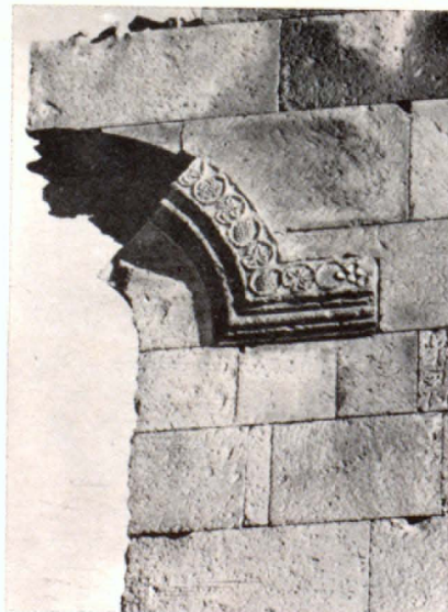
Հարավային ճակատի կամարաղեղի մանրամասն