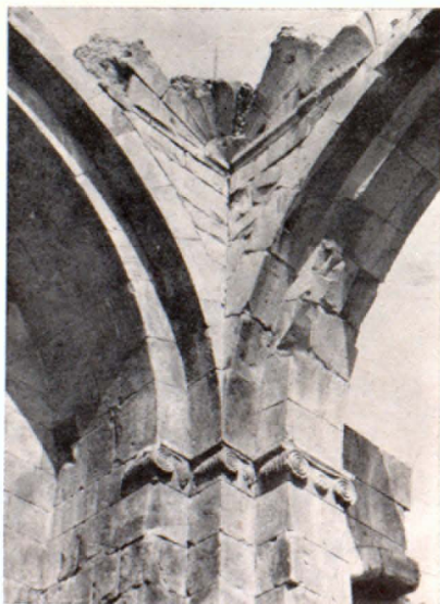
Հյուսիսային տրամպի ընդհանուր տեսքը

Ճակատներին պահպանվել են պատուհանների պսակները բուսական և կենդանական զարդամոտիվներով, որը բնորոշ է վաղ միջնադարի հուշարձանների համար: Ուշադրով է հարավային կենտրոնական պատուհանի պսակը: Գրա կամարունքում կլոր մեղալիոնների մեջ տեղավորված են սրբապատկերները՝ հրեշտակները, իսկ կենտրոնում պատկերված է Հիսուսը մեղալիոնի մեջ: