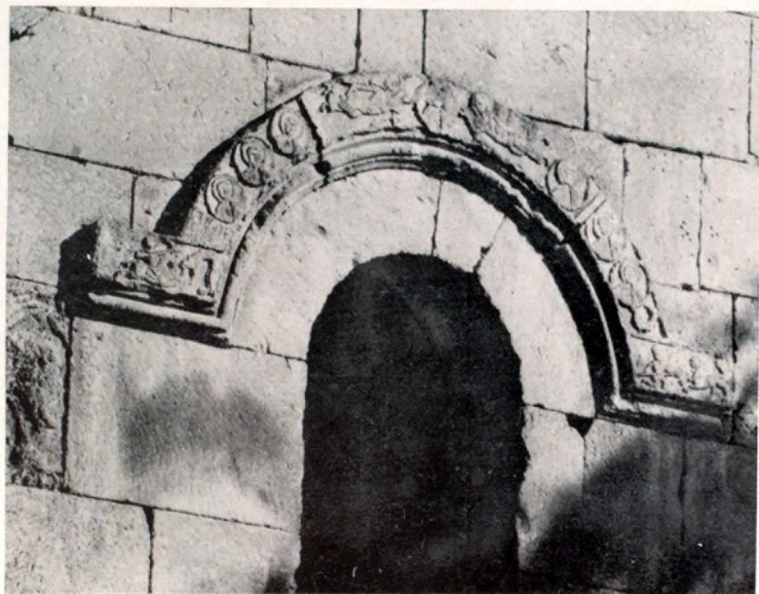
Հարավային ճակատի կամարաղեղը

Հարավային պատի վրա պահպանվել են երկու քանդակազարդ ֆարթեր, որոնք խիստ տարբերվում են թե՛ քանդակի սյուժեով, և թե՛ քանդակի կատարման