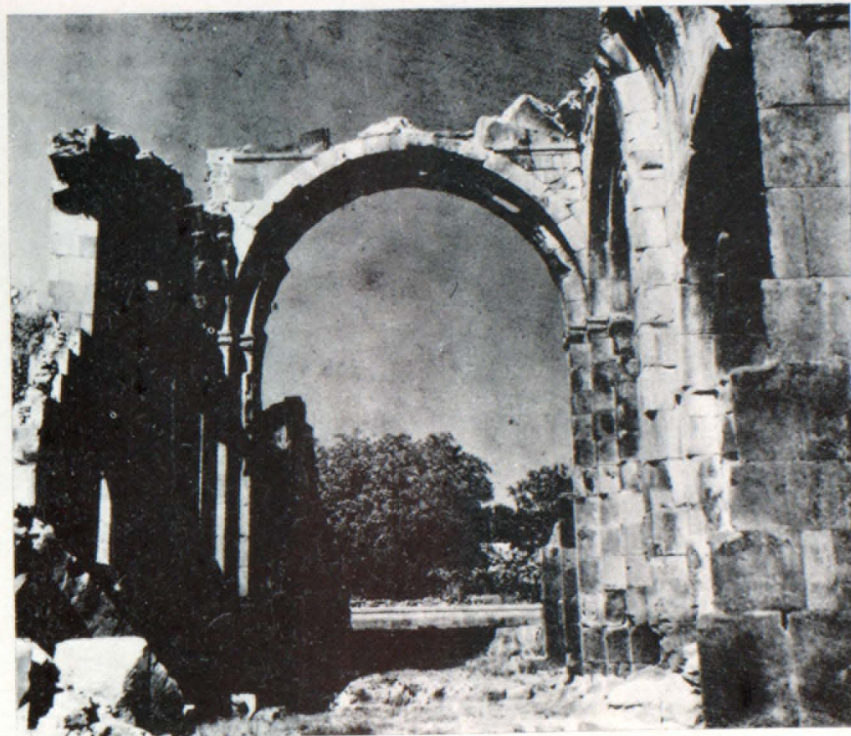
Ներսի բնդհանուր տեսքը