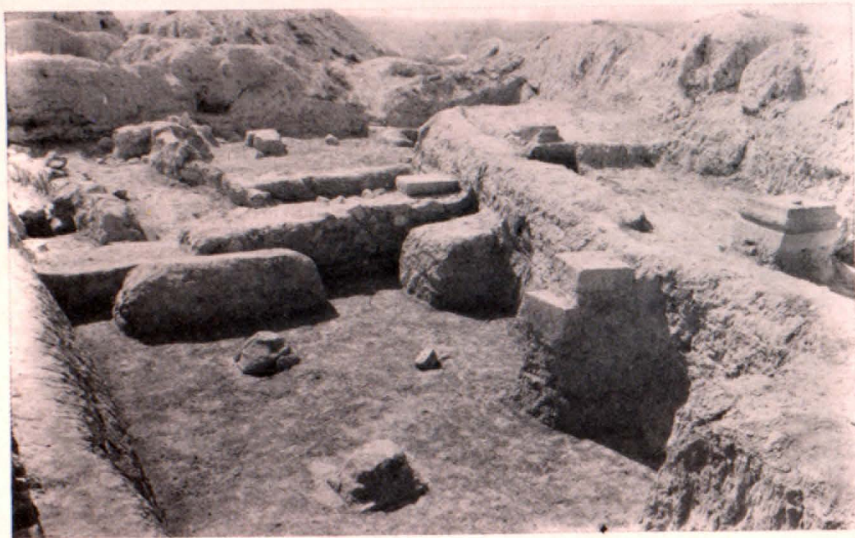
Հիւն և վաղ միջնադարյան շինությունների հետքեր

շանում Գլխնում հատված զրամների գանձերի ձևով գտնվել են Մերձբալթիկայում, Սկանդինավյան երկրներում և այլուր: Հայ և արաբ պատմիչները գովեստով են խոսում Գլխնում արտադրված կերպասեղենի, գորգերի, բարձերի, ժանյակների և արհեստային արտադրանքի այլ տեսակների մասին: