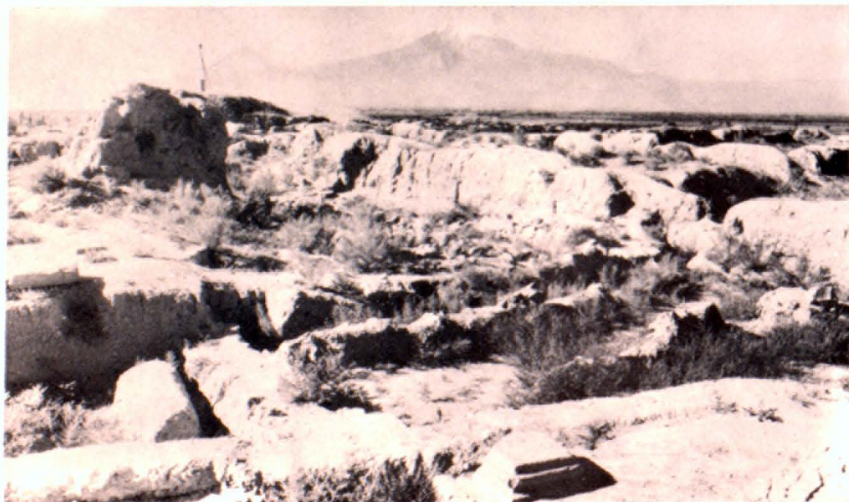
Ընդհանուր տեսարան միջնաբերդի զազարում