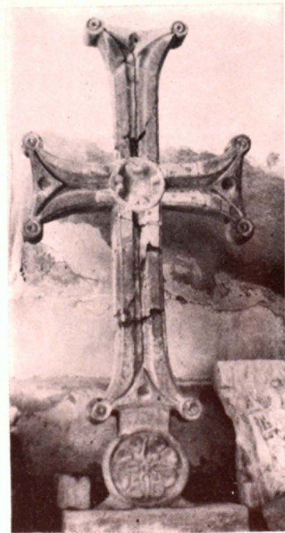
Քարե բեալոբ խաչ (VI դ.)