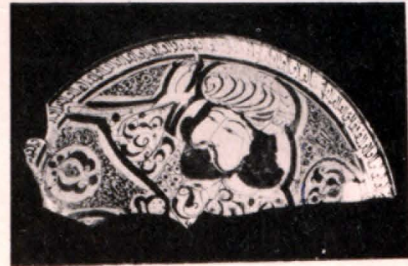
Հախճապակե սկանակ (XI—XIII դդ.)

եղել է խոշոր բնակավայր, որը հայտնի է իր պաշտամունքային կառույցներով, խեցեղենով և այլ բարձրարժեք ու նյութերով: Մ. թ. ա. II—մ. թ. I դարերում նույն տարածքում հիմնվել է հելլենիստական բնակավայր, որը Արտաշատը շրջապատող ավաններից մեկն է եղել և կարևոր դեր կատարել մայրաքաղաքի պաշտպանական համակարգում: