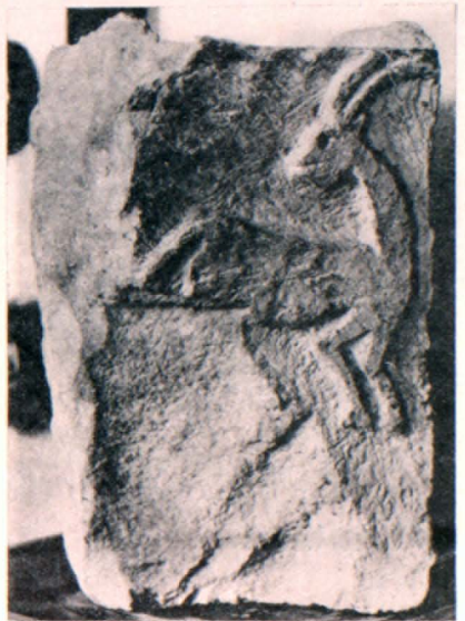
Խոյակ (V—VII դդ.)

VII դ. առաջին երկու տասնամյակներում կառուցվում է երկրորդ կաթողիկոսարանը եկեղեցու հյուսիսային մասում: Վերջինս նույնպես ունի կենտրոնական սյունազարդ սրահ 4 զույգ սյուներով, որոնք ավարտվել են ծածկը կրող արմավենազարդ շքեղ խոյակներով: