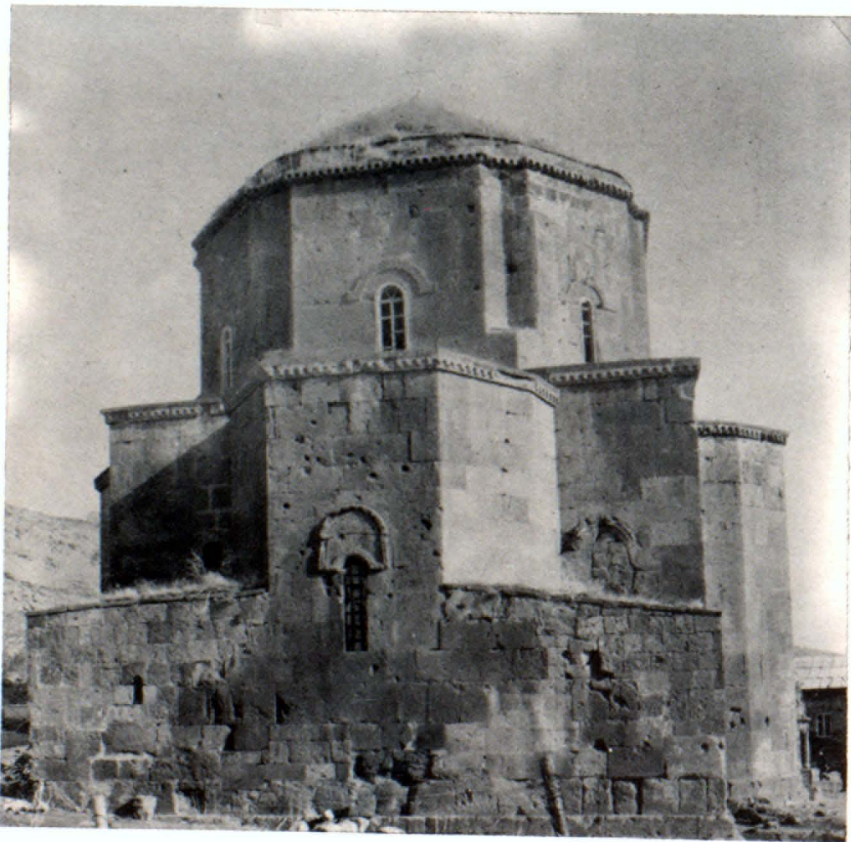
Տեսքը արևմտյան կողմից

Պատմական Արագածոտն գավառը հա- րուստ է ճարտարապետական մեծարժեք հուշարձաններով: Գրանց թվին է պատ- կանում Մաստարայի ս. Հովհաննես եկե- ղեցին (Հայկական ՍՍՀ Բալինի շրջանի համանուն գյուղում): Այն գլխավորում է կենտրոնագմբեթ, արտաքուստ և ներ- քուստ խաչաձև եկեղեցիների խումբը, որի մեջ մտնում են Արթիկի մեծ, Հա- ռիճավանքի ս. Գրիգոր, Ոսկեպարի ս. Սարգիս և Կարսի ս. Առաքելոց (X դ.) եկեղեցիները: