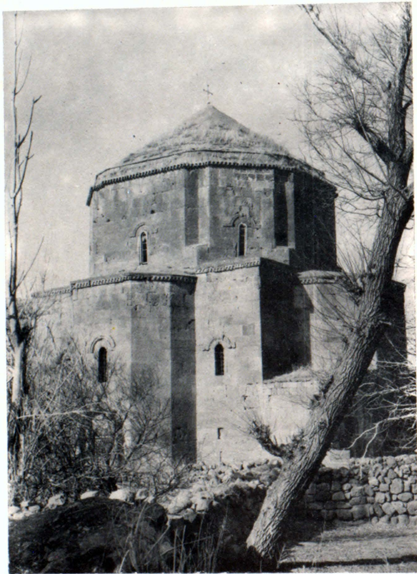
Բեղեսնուր տեսքը հառավ արևելից