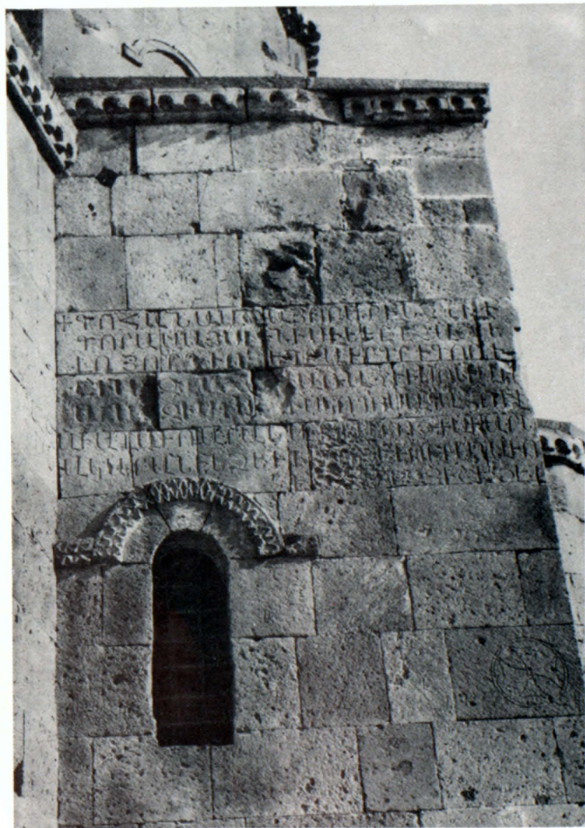
Արևմտյան պատի արձանագրությունը