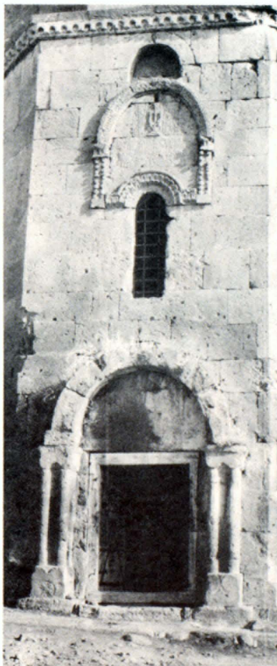
Արևմտյան մուտքը և լուսամուտը

Գմբեթակիր մույթերից հրաժարվելը թելադրել է կիրառել աղոթարանի ծածկի միանգամայն նոր, առավել բարդ կոնստրուկտիվ լուծում: Այն իրականացված է՝ հենելով ծածկը որպես հենախորշեր ծառայող կիսաշրջան խորանների