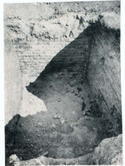
Ուրարտական սենյակ (VIII—VII դդ. մ. թ. ա.)

Արմավիրի բլուրի վրա հնագետները բացել են ուրարտական պարիսպը: Այն կառուցված է հում աղյուսից, քարե՝ բազալտի և հրաբխաքարի հիմքի վրա: Պարսպի հիմքի քարերը տեղ-տեղ կոպիտ