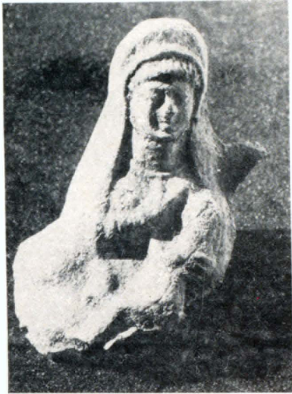
Կավե արձանիկ (II—I դդ. մ. թ. ա.)