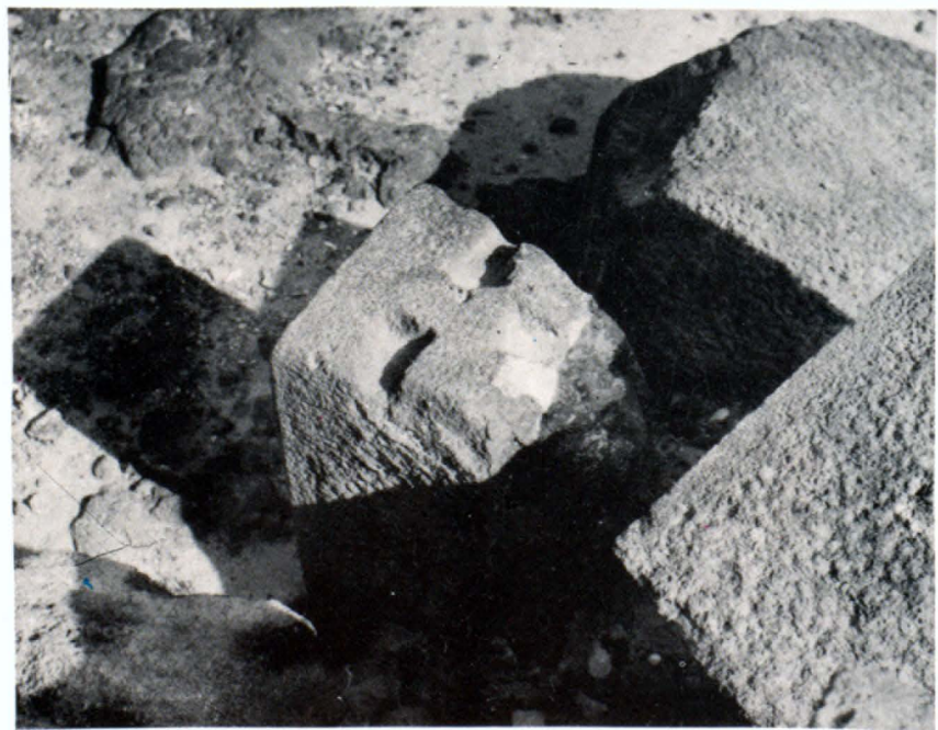
Հելլենիստական դարաշրջանի վեմեր մետեղյա կապերի համար փորվածքներով։

Արմավիրի քաղաքային թաղամասերը տարածվում էին դեպի արևմուտք մինչև Նոր Արմավիրի ժայռաբլուրները։ Այստեղ հիմնադրվում է հելլենիստական դարաշրջանի ազարակ, որի բնակիչի սենյակները շեռուցվում էին բուխարիներով, իսկ տնտեսական բաժանմունքում գործում