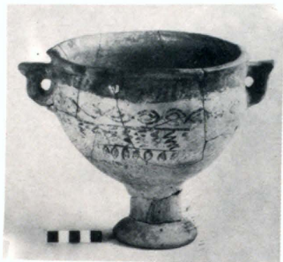
Գունազարդ կրատերիսկոս (III—II դդ. մ. թ. ա.)

շենքերը կանգուն էին և պիտանի օգտագործմանը։ Երվանդունիների պալատական համալիրն են դառնում արևելյան լանջի քաղմասնայակ երկու շենքերը։ Ուրարտական տաճարը վերափոխվում է հայ արքաների Արևի և Լուսնի տաճարի։ Մուտքը ավելի արդյունավետ կերպով պաշտպանելու համար, ամրոցի հյուսիս-արևմուտքյան անկյունում, լանջն ի վայր, կառուցվում է կիսաբլուր մի աշտարակ, որի քարերը իրար միացվել են ծիծեռնակապուշի ձև ունեցող երկաթե կապիտով։ Ամրոցի արևմտյան մասում իրար զուգահեռ երկու պարիսպների միջև ընկած տարածքում տեղավորվում են ամրոցի ավելի համեստ կարգի բնակիչների, սպասավորների կացարանները։ Բլրի հարավային ստորոտում Երվանդ թագավորը երկու ժայռաբեկորների վրա դրոշմել է տալիս հունարեն արձանագրություններ, որոնք պատմում են մ. թ. ա. III դ. վերջին քաղաքական անցքերի, Արևի պաշտա-