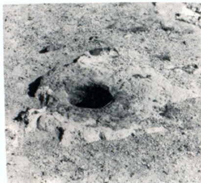
Միջնադարյան հեձանի ճոր