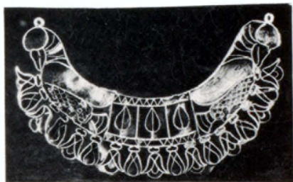
Ոսկե կրծքազարդ (V—IV դդ. մ. թ. խ.)

էին խաղող ճզմելու հարմարանքներ, անգամ հնձաններ: Մ. թ. առաջին դարերում կյանքը քաղաքում աստիճանաբար մարում է: Արշակ թագավորի օրոք (մ. թ. IV դ.) Արմավիրը լքված ամրոց էր: