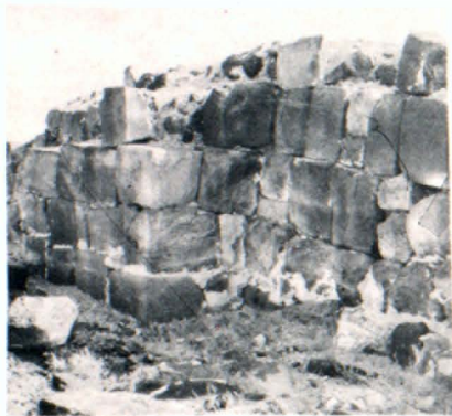
Տանառային շենք (միջին դարերում վերակառուցված)