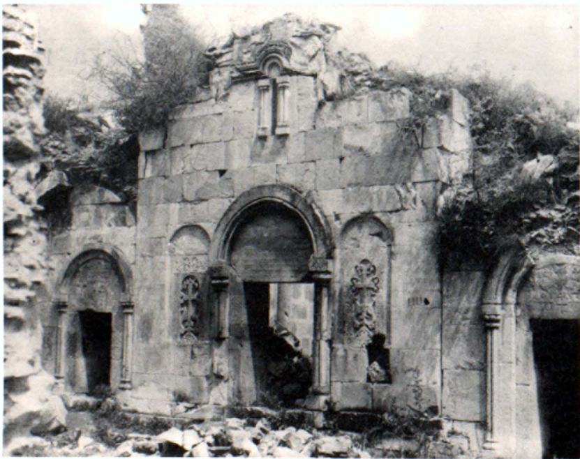
Ս. Նշան եկեղեցու արևմտյան ճակատ

Ենթադրվում է, որ ինչպես տապանատան, այնպես էլ մատուռի վերնահարկերը ծառայել են որպես ավանդատներ Ս. Նշան եկեղեցու համար: Այնտեղ բարձրացել են շարժական սանդուղքների միջոցով: