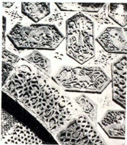
Ս. Ասովածածին Եկեղեցու արևմտյան շխմուտքի մանրամասն