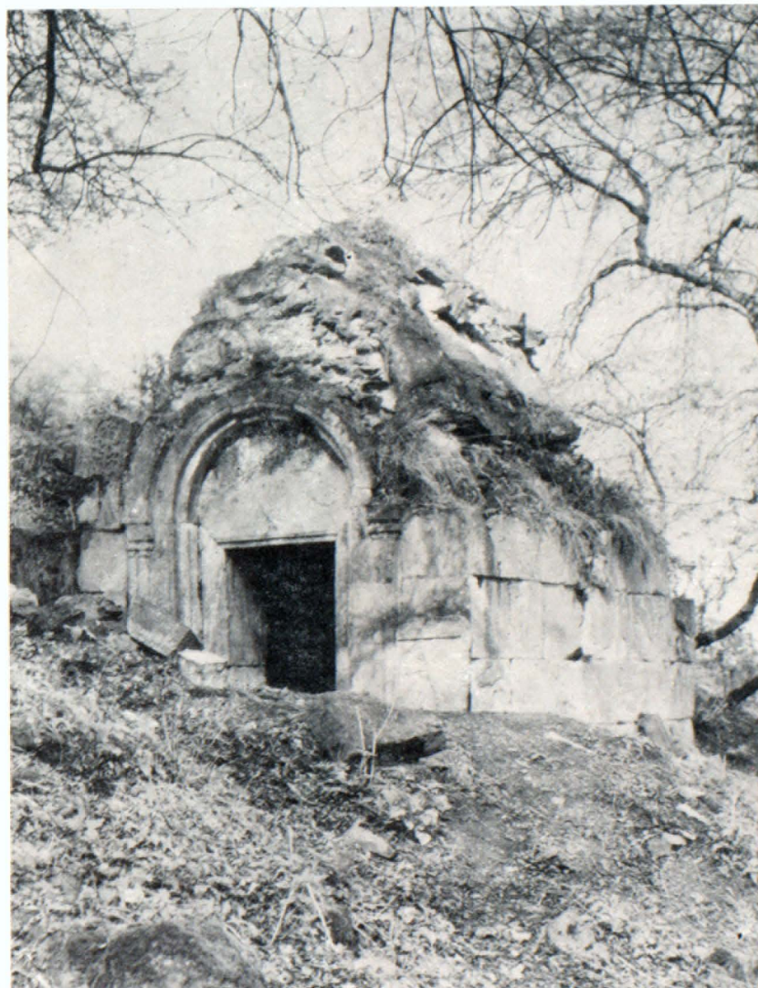
Մատուռ, տեմք հարավ-արևմուտքից

շատված ս. Աստվածածին եկեղեցու արևմտյան շքամուտքից