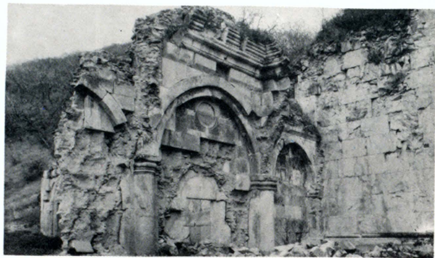
Փոքր գավթի արևմտյան պատի ներքին տեսք

Ս. Աստվածածին եկեղեցին համալիրի գլխավոր շինությունն է: Արձանագրությունների և XIII դ. պատմիչ Կիրակոս Գանձակեցու հաղորդած տեղեկության համաձայն այն կառուցվել է 1224—1237 թթ.՝ Դավիթ որդի Վասակ Բ-ի կողմից, իսկ օծումը տեղի է ունեցել 1240 թ.: Ճարտարապետն է անեցի Գազանը: Եկեղեցին արտաբուստ ուղղանկյուն (10,25×15,40 մ), ներքուստ խաչաձև հատակագծով գմբեթավոր զահլիճ է: Չորս անկյուններում գտնվում են կրկնահարկ ավանդատներ, որոնցից արևմտյան զույգի երկրորդ հարկերը բարձրանում են շթարարի մշակույթներ ունեցող բարձակային աստիճաններով: Եկեղեցին ունի երկու շքամուտք՝ արևմտյան և հարավային կողմերից: Արևմտյանն առանձնանում է ճոխ ճարտարապետական հարդարանքով, որում աչքի են ընկնում գունավոր և ձևավոր քարերի համադրամամբ քանդակները: