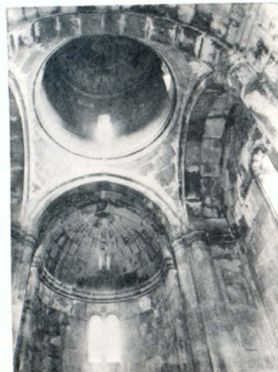
Ս. Աստվածածին եկեղեցու ներքին հորինվածքը

Նոր Վարագավանքի ճարտարապետական համալիրը զարգացած միջնադարի հայկական մեծարժեք հուշարձանախմբերից է: Այն գտնվում է ՀՍՍՀ Շոտլադինի շրջանի Վարագավան (մինչև 1978 թ.՝ Հախում) գյուղից մոտ 3,5 կմ հարավ-արևմուտք, անտառապատ սարերով ու գեղատեսիլ ձորերով շրջապատված բարձրադիր փոքրիկ բացատում: