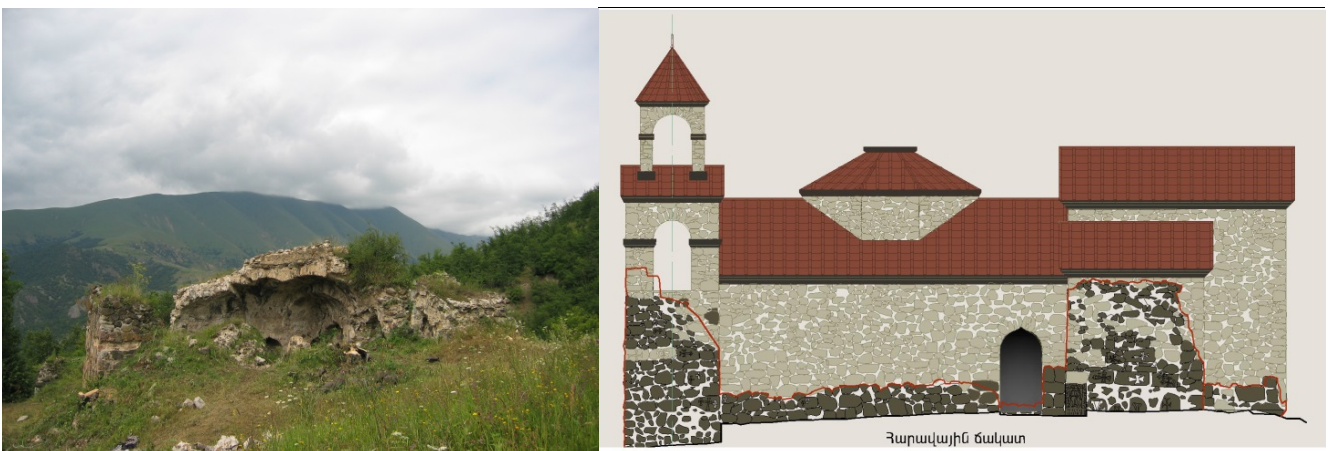
Նկ.3. Հանդաբերդի վանքի շինությունների հիմնական խումբը պեղումներից առաջ և