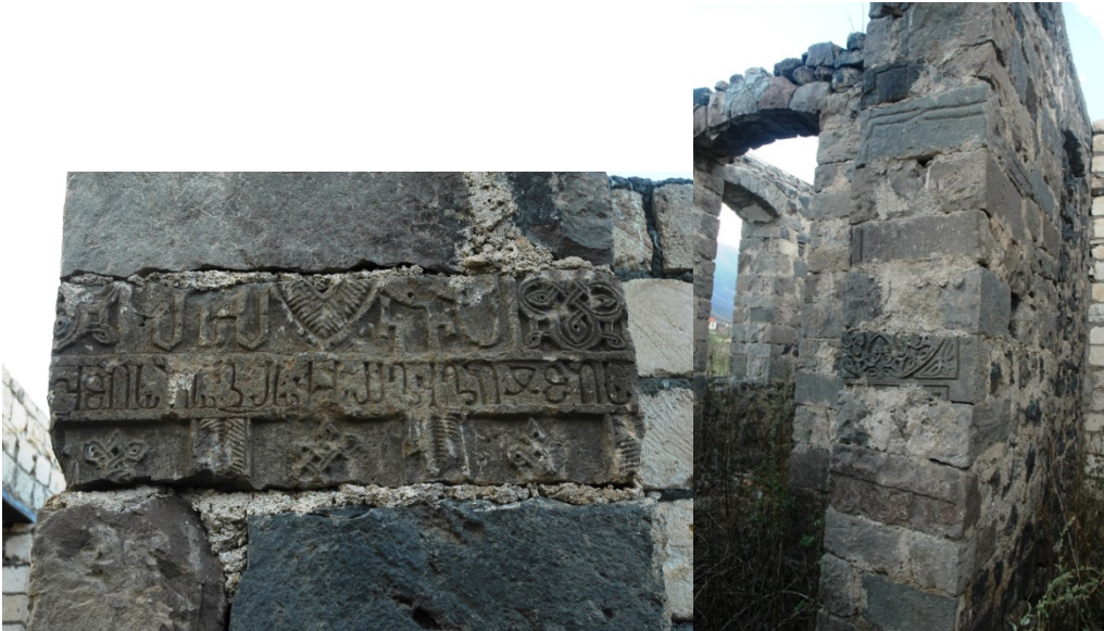
Նկ.2. Ծար. Խորհրդային շրջանում կառուցված դպրոցի պատերի մեջ որպես շինաքար օգտագործված ջարդոտված խաչքարերի և արձանագրակիր քարերի բեկորներ:

Մեկ այլ՝ Եղեգնուտ գյուղում տան պատի շարքում որպես շինաքար էր օգտագործվել խաչային հորինվածքով քարը: Հանդաբերդի վանքում պայթեցվել էր գավիթը, որի հետևանքով ծածկի զգալի մասը ավերվել և թափվել էր ներսում: Կանգուն շինությունների մեծ մասն էլ շատ անմխիթար վիճակում էր: Տեղահանվել և նաև ձորն էին գլորվել վանքի շուրջը գտնվող միջնադարյան գերեզմանոցի շատ տապանաքարեր և խաչքարեր: Արցախի ազատագրումից հետո հնարավոր դարձան վանքի պեղումները և շրջակայքի հետազոտությունը (Պետրոսյան Հ., Կիրակոսյան Լ., Սաֆարյան Վ., 2009, էջ 30-47): Երկամյա պեղումների արդյունքում ամբողջովին մաքրվեց, ամրակայվեց և մասնակի վերականգնվեց Հանդաբերդի վանքը (Կիրակոսյան Լ., 2010, էջ 127):