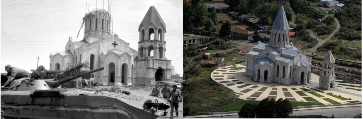
Նկ.1. Շուշիի Սբ. Ամենափրկիչ եկեղեցին՝ ազատագրումից և վերականգնումից հետո:

1991թ. Շուշիի Մեղրեցոց եկեղեցին վերածվել է ամառային կինոթատրոնի, Կանաչ ժամը՝ հանքային ջրերի սրահի, որի հետևանքով եկեղեցու կառույցն էլ է վտանգվել (Մելիք-Շահնազարյան Լ., 1998, էջ 149-150): 1990թ. մայիսի 20-ի համարում <<Սովետական Ղարաբաղ>> թերթը գրում էր. <<Ադրբեջանական զինված բանդայական ձևավորումները չեն դադարեցնում գազանությունները Ամարասի հովտում: Այստեղ տեղափոխված տնտեսական կառույցների ավերելուց և թալանելուց հետո մայիսի 18-19-ին նրանց գազանությունների օբյեկտը դարձավ Ամարասի վանքը: Իրենց հետ բերելով ավերման անհրաժեշտ ողջ տեխնիկան, հանցագործները ջարդեցին վանքի դռները և պատուհանները, գողացան կահույքը, հափշտակեցին վանքի գանձարանը>>: