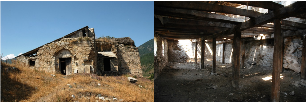
Նկ.4. Չարեքտարի վանքի ընդհանուր տեսքը և գոմի վերածված եկեղեցու ներքնատեսքը ադրբեջանական օգտագործման ժամանակ:

Չարեքտարի վանքի, որը գտնվում է Արցախի Վերին Խաչեն գավառում՝ (այժմ՝ ԼՂ Մարտակերտի շրջան, գյուղ Չարեքտար) կառույցները ձևափոխվել էին և տասնամյակներ շարունակ օգտագործվել որպես անասնագոմեր: Այսօր այստեղ նույնպես պեղման և հետազոտական աշխատանքներ են իրականացվել և վանքը ներկայանում է քայքայված, բայց նախնական կազմով (երեք եկեղեցիներ, գավիթ, սրան հարավից կից սրահ, գավթին հյուսիսից կցված զույգ աշտարակներով պարիսպ) (Այվազյան Ս., Սարգսյան Գ., 2011, էջ 48-58):